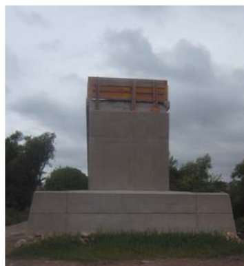
Cyklomost: Takto je zatiaľ ukončený most v Rakúsku