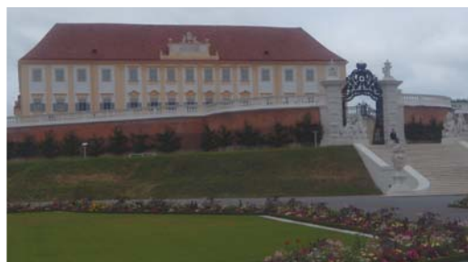
Zámok Schlosshof: Z cyklomosta ho uvidíte už z diaľky

Zaujímalo nás, ako to vyzerá na rakúskej strane s cyklomostom, po ktorom sa dostaneme z Devínskej Novej Vsi do Schlosshofu.