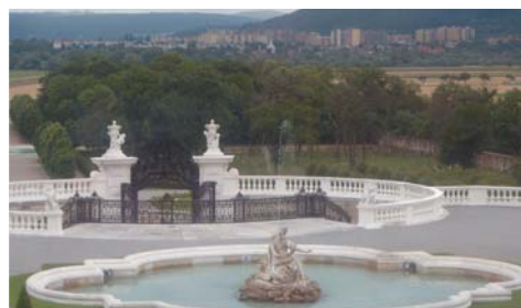
Pohľad zo Schlosshofu na Devínsku Novú Ves

ktorá má viesť ponad rieku Moravu až do Devínskej Novej Vsi. Ak sa dostanete ku kamennému mostu, objaví sa pred vami nádherný zámok Schlosshof, ku ktorému vedie cestný nájazd pre cyklistov. Na Slovensku by sa mohlo začať s výstavbou mosta ešte tento rok. Z celkovej dĺžky cyklomosta 955 metrov tvorí ocelová mostná konštrukcia 525 metrov. Cyklomost bude široký 4 metre, čo umožní v prípade potreby aj prejazd záchranárov. Výška mosta nad hladinou Moravy umožní v budúcnosti bezpečnú