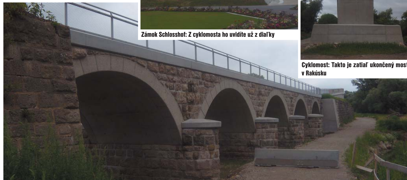
Most v Rakúsku: Je súčasťou cyklomosta do Devínskej N. Vsi. Je postavený na mieste historického mosta vybudovaného z čias Márie Terézie. Od zámku Schlosshof je vzdialený cca 400 metrov.

Ak by ste sa dnes prišli pozrieť do Schlosshofu na cyklomost, uvideli by ste kamenný most s piatimi klenbami. Rakúšania ho zrekonštruovali z mosta pre konskú železnicu, ktorý dala v roku 1771 postaviť cisárovná Mária Terézia. Z neho však zostali len tehlové klenby na kamenných pilieroch. Tehlové oblúky boli zbúrané a nahradili ich nové železobetónové, a to tak, aby zostala zachovaná historická podoba mosta. Zrekonštruovaný kamenný most je dlhý 56 metrov a ďalej zatiaľ nepokračuje. Napojí sa na ocelovú konštrukciu,